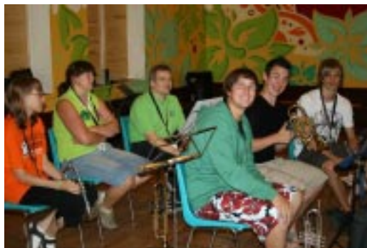
Brass Band Workshop 2010

Für diese Workshops entscheidet Ihr Euch im Vorfeld. Es gibt jeweils einen Block am Freitag und Samstag, Ihr könnt also 2 Angebote wählen. Tragt bitte Eure Favoriten ins Anmeldeformular ein. Wählt bitte Eure TOP 5 (von 1 „unbedingt“ bis 5 „wenn's nicht anders geht“), denn wir wissen noch nicht, wie viele Leute zur gleichen Zeit einen Workshop machen wollen. Wir teilen Euch ein und versuchen Euren Wünsche so gut es geht zu entsprechen.