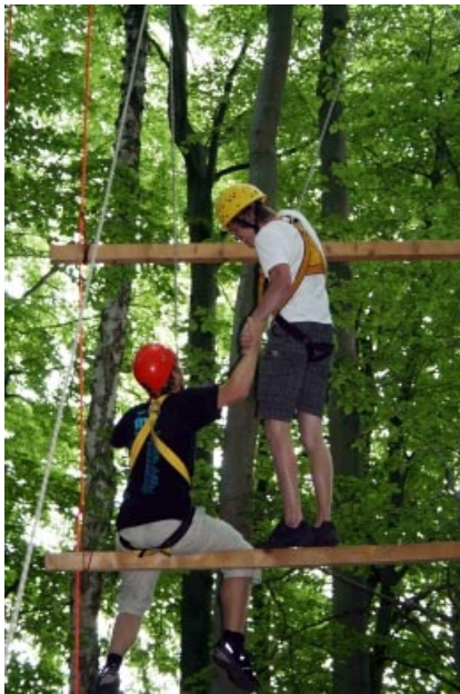
Workshop Outdoorspiele 2010

Alle Teilnehmenden können aus einer Vielzahl von Angeboten wählen und sich somit ein individuelles Programm nach den eigenen Vorlieben zusammenstellen. Alle angebotenen Workshops zeigen spannende Facetten der Jugendarbeit und sollen Anregungen für die eigene Arbeit vor Ort geben. Das reicht von Hochseilklettern über Selbstmanagement für Jugendleiter/innen bis zur Karriere mit Musik. Unsere musikalischen Workshops, die zum Teil mit Profidozenten stattfinden, bieten auch Einblicke in neue musikalische Felder. Detaillierte Infos zum Programm finden sich unter dem Punkt „Unsere Angebote“. Zum Jugendcamp gehören aber auch Spaß, Freizeit und Vernetzung. Gerade die Abendveranstaltungen mit Beachvolleyball oder Grillen laden zum Kennenlernen, Feiern und zum Schließen dauerhafter Freundschaften ein.