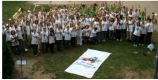
Abschlussveranstaltung Jugendcamp 2010

Das Jugendcamp der Deutschen Bläserjugend ist alle zwei Jahre der große, bundesweite Treff für junge Menschen aus ganz Deutschland. An vier spannenden und erlebnisreichen Tagen bietet das Camp ein umfangreiches überfachliches Workshopprogramm, jugendpolitische Talkrunden, Musik- und Freizeitangebote. Das Camp steht unter der Schirmherrschaft von Bundesjugendministerin Dr. Kristina Schröder.