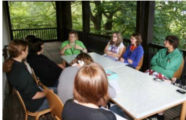
Workshop Vorstandsarbeit 2010

Wir haben auch für das Jugendcamp 2012 wieder ein umfangreiches Workshopprogramm zusammengestellt. Die Workshops finden in fünf verschiedenen Blöcken am Freitag, den 03.08.2012 und Samstag, den 04.08.2012 statt. Sie werden vor Ort individuell gewählt. Jede/r Teilnehmende erhält so die Möglichkeit bis zu fünf überfachliche Themen zu bearbeiten. Details gibt's auf www.dbj-jugendcamp.de